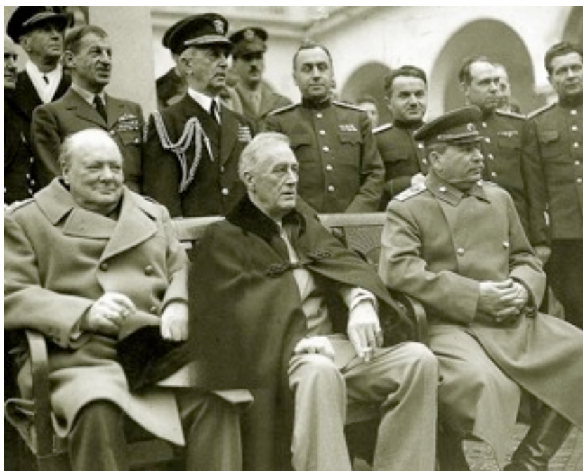
Слева направо: Черчилль, Рузвельт, Сталин.

В отношении Германии союзники были едины.